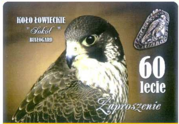
KŁ SOKÓŁ BIAŁOGARD