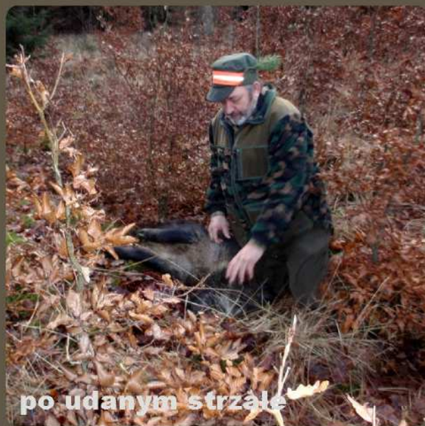
po udanym strzale