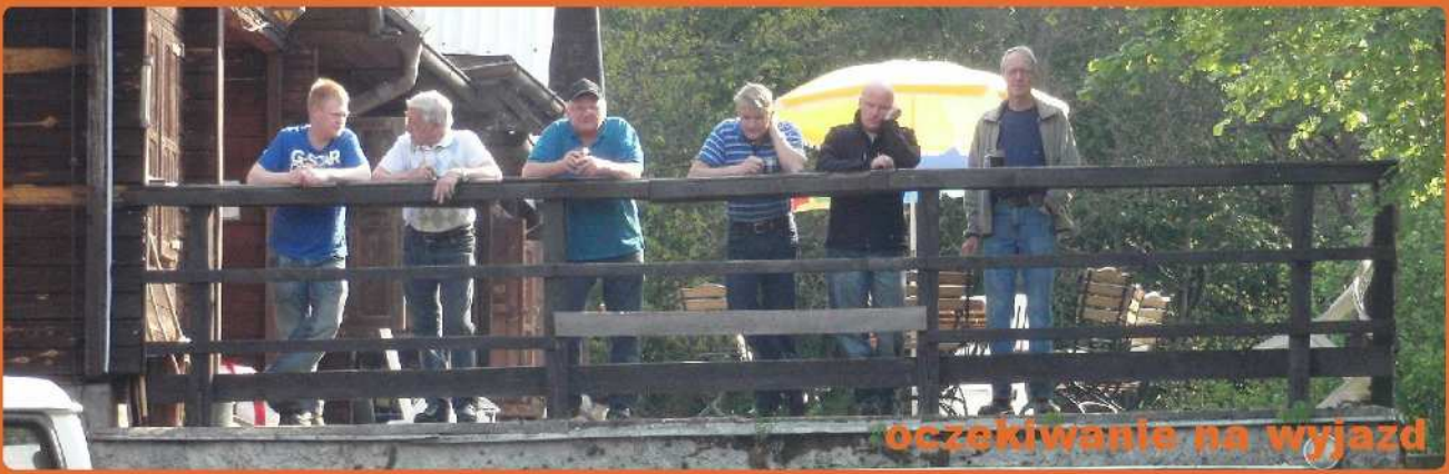
oczekiwanie na wyjazd