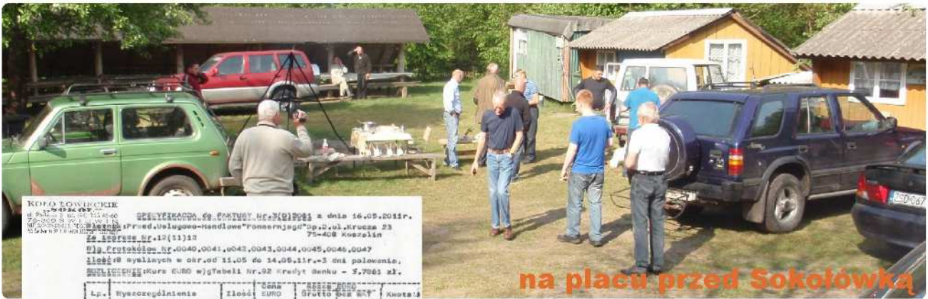
na placu przed Sokolówką