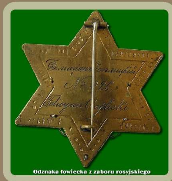
Odznaka łowiecka z zaboru rosyjskiego

A to już starsze pamiątka - odznaka łowiecka z zaboru rosyjskiego. Wygrawerowane na odwrocie numer i dane personalne świadczą o tym, że odznaka pełniła też rolę legitymacji.