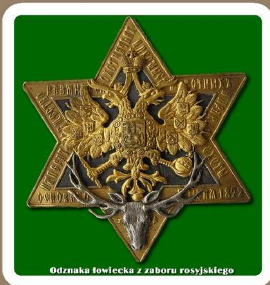
Odznaka łowiecka z zaboru rosyjskiego