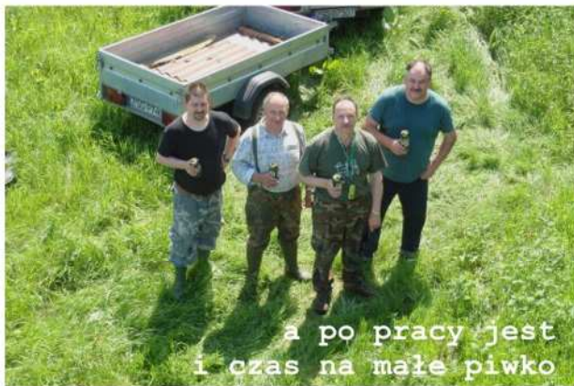
a po pracy jest i czas na małe piwko