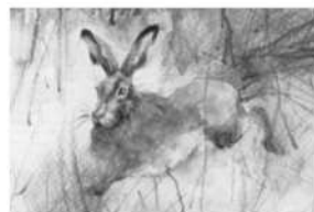
STRZELA WŁODEK PILARZ