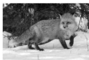
STRZELA ŁUKASZ PIEKARSKI