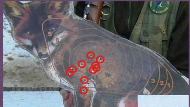
PRZESTRZELINY KULOWE JACKA