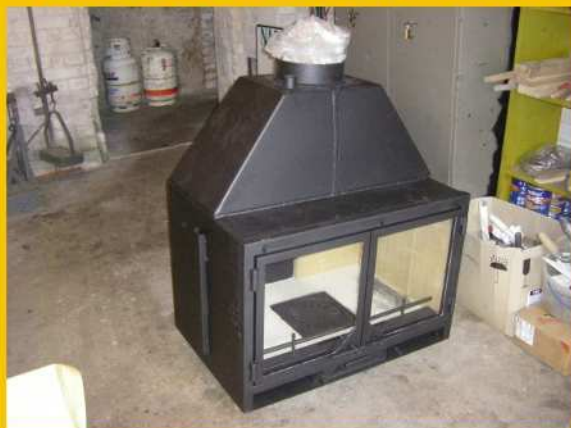
NOWOZAKUPIONY KOMINEK - KOCIOŁ

P ogoda w tegorocznym marcu była ja zwykle, czyli "jak w garncu". Ale w sumie nieźła. I również jak co roku, tak i w tym, "leniuchowaliśmy łowiecko" w tym miesiącu. Najzagorzalsi polowali jeszcze trochę na lisy, których w tym roku jakby mniej było widać, ale większość kolegów odwiesiła w marcu flinty (mamy nadzieję, że poczyszczono) na bok. Zarząd natomiast powoli podsumowywał rok i szykował się do następnego sezonu. Dokonano inwentaryzacji zwierzyny, a łowczy przygotowywał i satwierdzał plany na sezon 2008-2009. W połowie miesiąca odbyła się coroczna ocena prawidłowości odstrzałów byków jeleni (i oczywiście danieli, co nie dotyczyło niestety naszych łowisk).