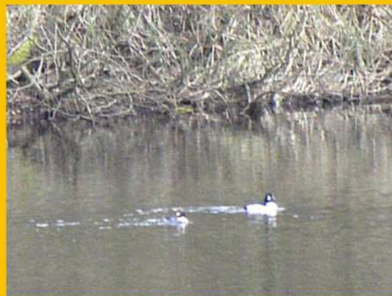
GĄGOŁY NA STAWKU PRZY SOKOŁÓWCE

Korzystając z dobrej w tym roku sytuacji finansowej, zarząd postanowił założyć w Sokołówce centralne ogrzewanie zasilane z kominka z płaszczem wodnym.