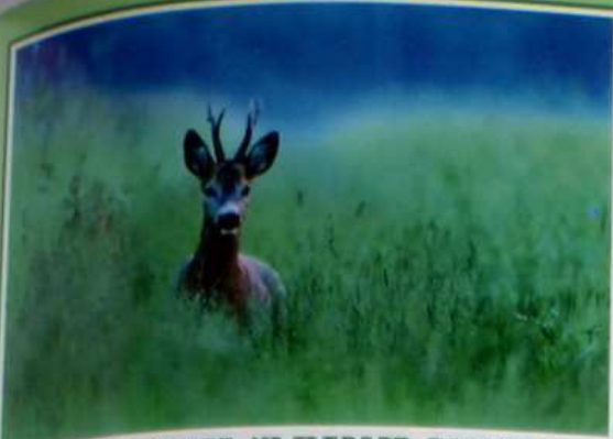
OD LAT NASZE NAJLEPSZE ROGACZE BYTUJA W OBWODZIE NR 139