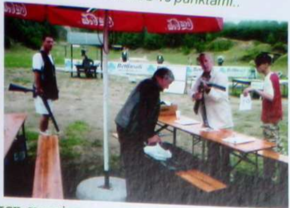
NA STRZELNICY W ŁĘŻKU