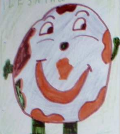
Ola Ratajczak kl. IIe S.P. nr 1 w Świdwinie

leśnię - odpowiedział I wysyci na to - mło cię porwać! Taki leśniczy rannym rano sz łemulam