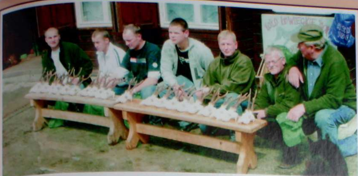
PRZED SOKOŁÓWKĄ ZAKOŃCZENIE POLOWANIA PRZEZ JEDNĄ Z SYMPATYCZNYCH GRUP Z DANII