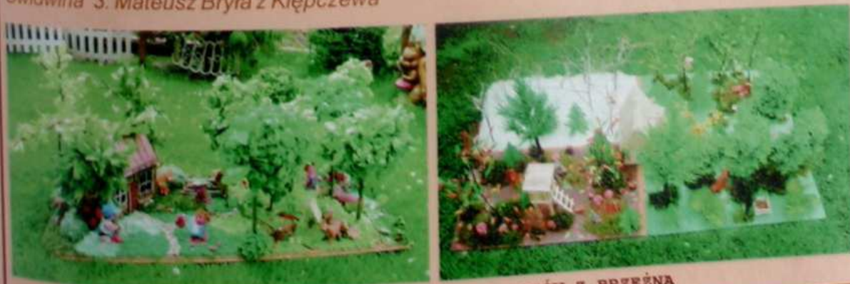
PRACE PRZESTRZENNE GIMNAZJALISTÓW Z BRZEŻNA