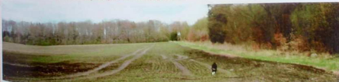
“OSIEMNAŚCIE HEKTARÓW” W ŁOWISKU MIĘDZYRZECZ

Osiemnaście hektarów pole otoczone z czterech stron lasem to jedno z ulubionych miejsc polowań kolegów z łowiska Międzyrzecz. A położony przy nim młodnik to znana ostoja dzików i jeleni często przez nas pędzona podczas dewizowych zbiorówek.