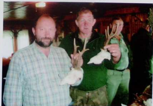
... I TROFEA