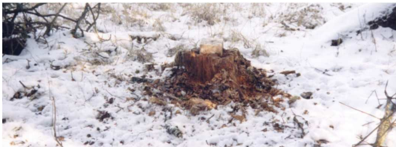
LIZAWKA W ŁOWISKU KARTLEWO